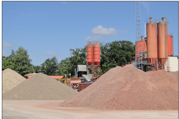
Betoncentrale Van Gorp

Betoncentrale Van Gorp beschikt in Turnhout over een breekinstallatie. Beton- en steenpuin wordt er verwerkt tot een herbruikbaar product.