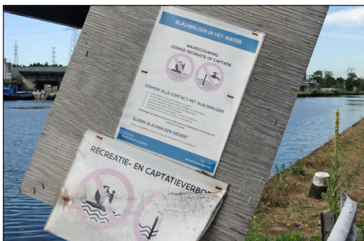
Alert voor blauwalgen