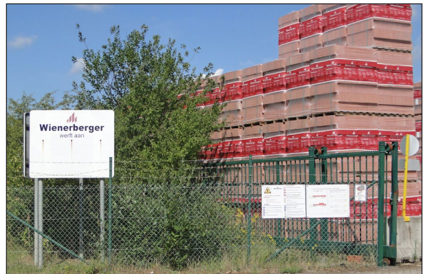
Wienerberger transporteert haar palletten per schip