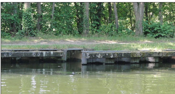
Fauna-uittreedplaatsen langs de oevers van het Kanaal Dessel-Turnhout-Schoten