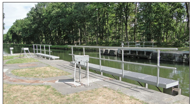
Keersluis in Dessel (Witgoor)