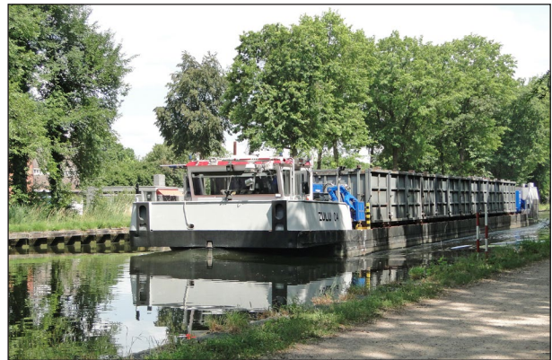
Ondiep 'palletschip' ZULU 04