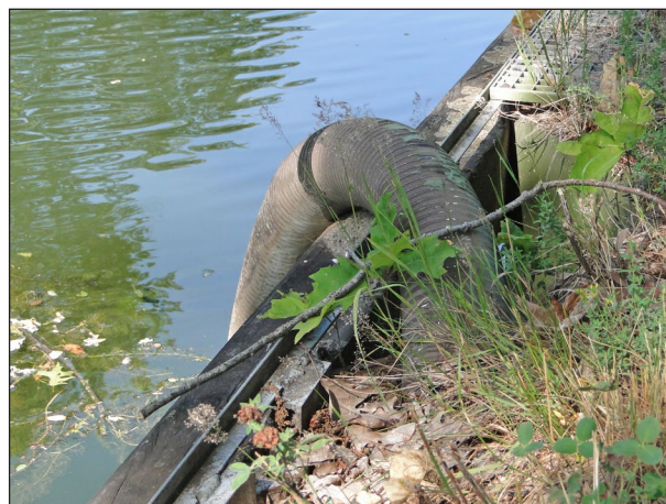
Water voor landbouw