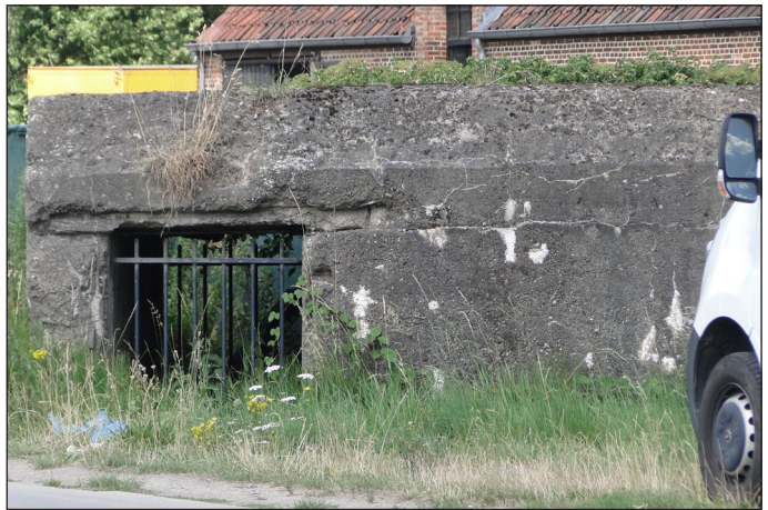
Bunkers uit WOII herbergen vleermuizen

Het kalkrijke Maaswater bevordert de groei van schelpdieren in het kanaal. Ze zetten zich vast op de breukstenen van de oevers en op de sluisdeuren.