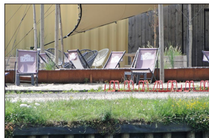
Pop up Zomer Bar in Beerse

Wanneer echter in droge periodes de temperatuur van het kanaalwater stijgt en de stroming beperkt is, activeert het opgestapelde fosfaat de groei van blauwalgen. Blauwalgen of cyanobacteriën zijn bacteriën die het water een blauwe, olieachtige, felgroene of roodbruine kleur geven. Ze zijn toxisch voor mens en dier. De waterwegbeheerder verbiedt tijdens dergelijke periodes alle watersportactiviteiten. Ook het milieubootprogramma wordt uit veiligheid aangepast wanneer er blauwalgen zijn.