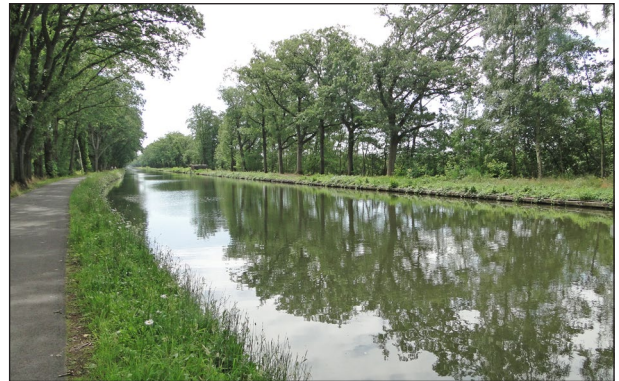
Door de Kempense kanalen vloeit Maaswater

In dezelfde periode werd ook het kanaal van Dessel naar Hasselt aangelegd. Pas bij de aanleg van het Albertkanaal in 1939 werd het gedeelte tussen Dessel en Kwaadmechelen gemoderniseerd om grote schepen die van de Zuid-Willemsvaart of Turnhout komen een vlottere verbinding met Antwerpen te geven. Dit deel heet nu het Kanaal Dessel-Kwaadmechelen.