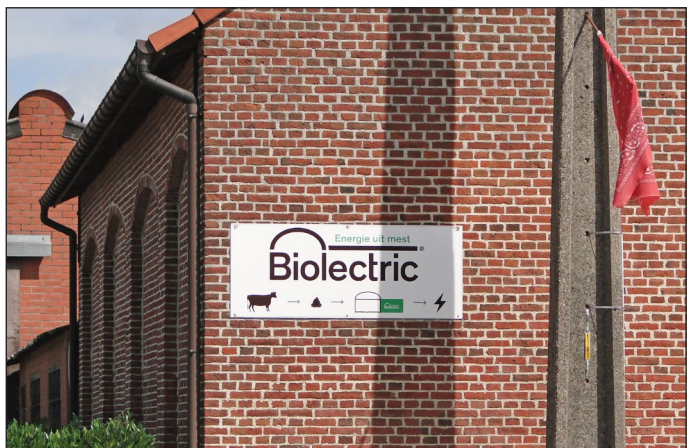
Elektriciteitsproductie uit mest

Vanaf het kanaal zijn de landbouwactiviteiten in de regio niet altijd goed te zien. Toch zijn er heel wat melkveebedrijven en akkerbouwbedrijven (maïs, asperges, aardappelen, koolsoorten, aardbeien,...). Sommige landbouwbedrijven ondernemen innovatieve stappen. Zo experimenteerde een melkveebedrijf Bioelectric' uit Beerse met een installatie die elektriciteit zou winnen uit vergisting van mest van hun vee. 'Spijtig genoeg ondervond deze landbouwer dat het zeer moeilijk is om ondersteuning en vergunning te krijgen voor dergelijk innovatief initiatief. Het experiment mislukte.