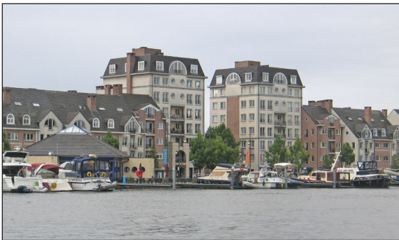
Wonen langs het kanaal in Turnhout