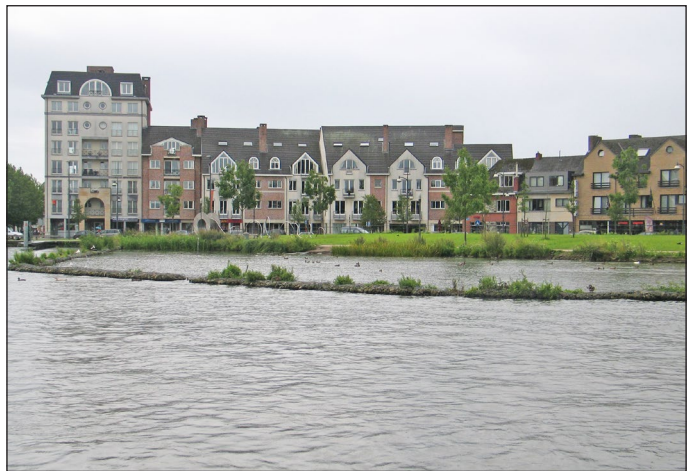
Paaiplaats voor vissen aan de Nieuwe kaai in Turnhout