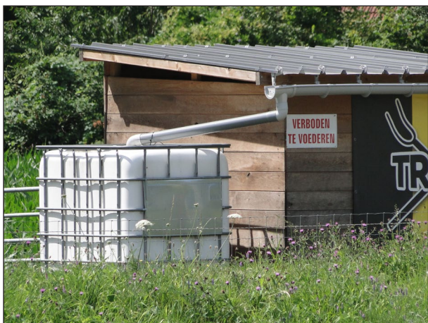
Wateropvang voor landbouw

In droge periodes overstijgt de vraag naar water vanuit de landbouw het wateraanbod. Het project 'Boeren op peil in Oud-Turnhout en Arendonk' ondersteunt landbouwers en natuurbeheerders in het afstroomgebied van de beken De Wamp en de Rode Loop om klimaatrobuste maatregelen te treffen. De Provincie Antwerpen en partners, de Vlaams Landmaatschappij (VLM) met Water-Land-Schap 2.0 en Blue Deal van de Vlaamse overheid zijn betrokken bij dit project om de strijd tegen droogte in de regio aan te gaan.