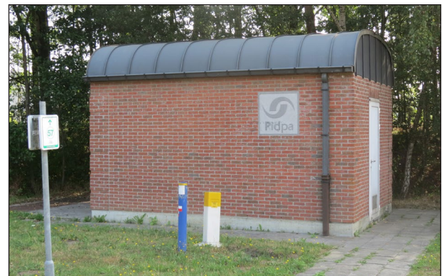
Drinkwaterwinning door Pidpa langs het Kanaal Dessel-Kwaadmechelen

Langs het Kanaal Dessel-Kwaadmechelen en het Albertkanaal liggen waterwingebieden waar grondwater wordt opgepompt om drinkwater van te maken. Voor de bevoeiing van deze gebieden wordt onder andere water uit het Kanaal Dessel-Kwaadmechelen gebruikt. Maar ook van het water in het Albertkanaal wordt drinkwater gemaakt. Het is dus belangrijk dat beide kanalen een goede waterkwaliteit hebben. Desondanks is de waterkwaliteit van het Kanaal Dessel-Kwaadmechelen onvoldoende. Het Albertkanaal scoort relatief goed is. De ongunstige structuurkenmerken als 'betonnen bak' maken echter dat er weinig kleine ongewervelde dieren (macro-invertebraten) en vissoorten voorkomen in beide kanalen. Bovendien bedreigen exoten, zoals de zwartbekgrondel, de inheemse vissoorten.