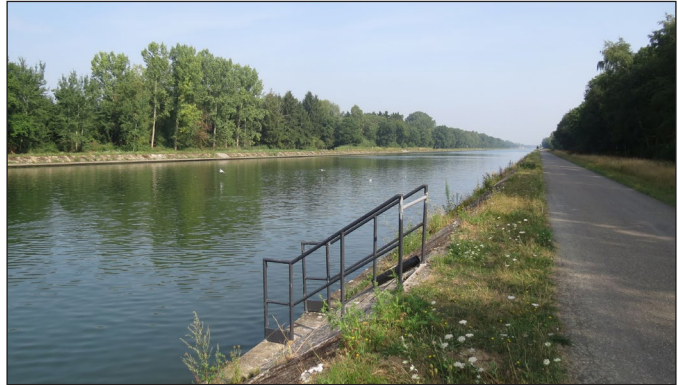
Het Kanaal Dessel-Kwaadmechelen

De ontginning van het hagelwitte kwartszand toverde het Molse landschap om in een vakantieparadijs met kristalheldere meren, schitterende zandstranden en waterrijke natuurgebieden. Jachthavens, het Provinciaal recreatiedomein Zilvermeer, een uitgebreid fiets- en wandelnetwerk langs de meren en het kanaal trekken de 'waterrecreatant' aan.