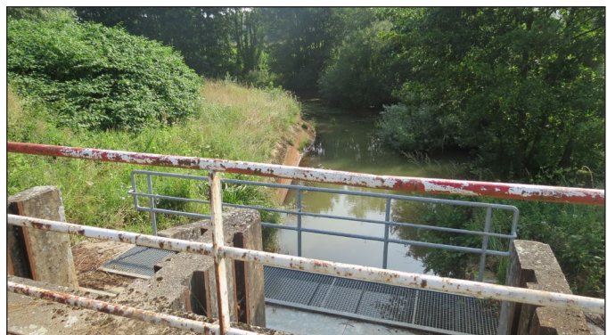
Duiker Grote Nete onder het kanaal

De meren die ontstaan door witzandontginning vormen een toevluchtsoord voor onder meer doortrekkende watervogels. In biotopen zoals vennen, moerassen, broekbossen, natte graslanden en weilanden die ontstaan door de vele zijbeken van de Grote Nete, alsook door spriet- (soort bruinkool) en turfonginning tijdens de Tweede Wereldoorlog, vindt men waterral (vogel), blauwborst, groene en bruine kikker, alpenwatersalamander, de zeldzame veldparelmoervlinder, wulp en kievit, roodborsttapuit, buizerd, torenvalk en nog veel meer. Door de goede waterkwaliteit van de beken hebben de waterlopen een gevarieerde visfauna met beschermde vissoorten zoals beekprik en biermpje.