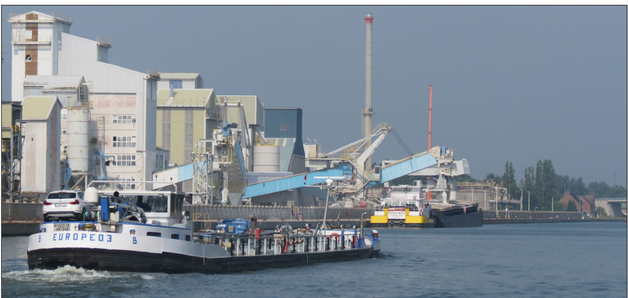
Tessenderlo Chemie langs het Albertkanaal